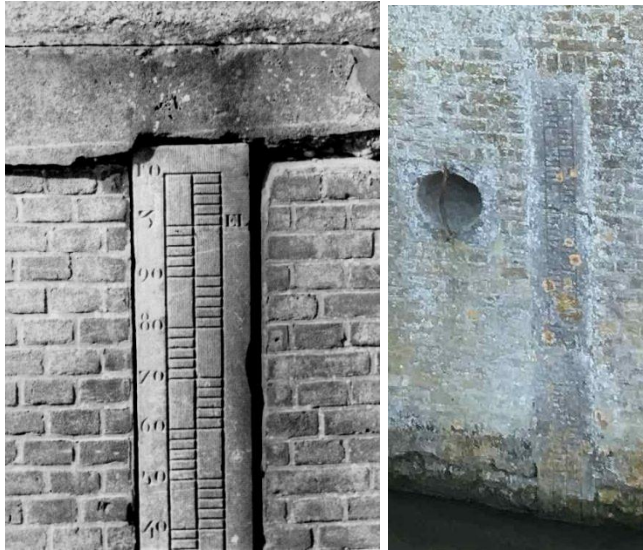
Peilschalen boven- en benedensluis

NB De eerste is in 1987 niet bewaard, ook niet als los object en evenmin in situ gewaterpast als basisinformatie voor waterstaatkundig onderzoek!