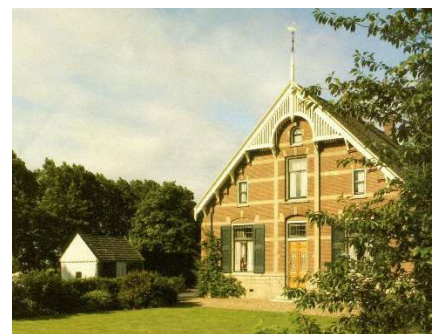
Drie voorbeelden van bedreigde monumenten waarvoor de historische organisaties zich inzetten. De Snelle sluis bij Moordrecht, de verkrottende Geertruidahoeve in Nieuwerkerk en de met succes behouden wagenschuur bij 't Land Kanaän in Zevenhuizen.