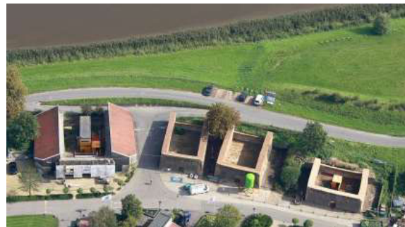
Luchtfoto steenovens Klein-Hitland 2010 Nieuwerkerk