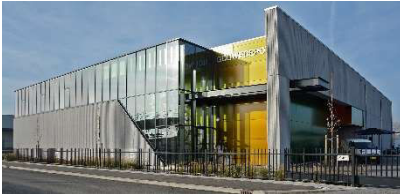
Het Gouwedepot van het archief

Zuidplas participeert, ter uitvoering van de Archiefwet 1995, als één van de vijf gemeenten in het Streekarchief Midden-Holland te Gouda (met Gouwedepot in Zuidplas!). De historische organisaties nemen deel met lidmaatschappen in de adviescommissie/klantenraad van het archief. Zij dragen er tevens zorg voor dat niet-overheidsarchieven die van historisch belang zijn in het archief worden onder gebracht.