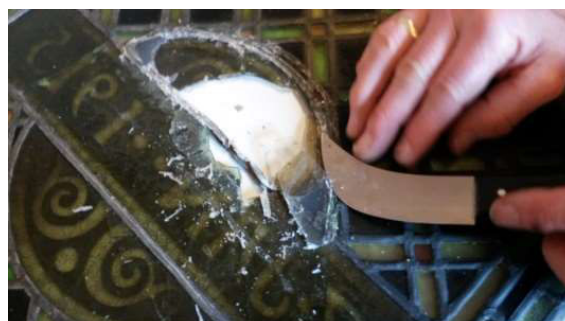
Restaureren van objecten