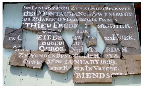
Grafsteen van drie verdronkenen 1829 – Moerkapelle