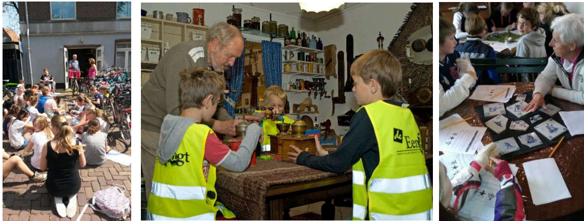
Schoolbezoeken aan de diverse oudheidkamers

Tijdens de nationale Open Monumentendag verzorgen de organisaties educatieve informatie omtrent het nationale jaarthema van Open Monumentendag en over de monumenten in de gemeente Zuidplas.