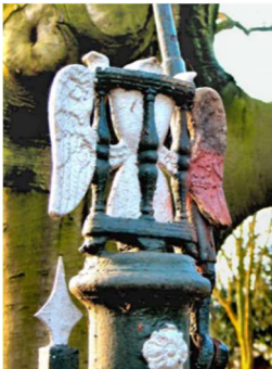
Gevleugelde zandloper hek Begraafplaats Nieuwerkerk

Intussen gaat in 2017 het ruimen nog steeds door zonder de vereiste gemeentelijke lijst.