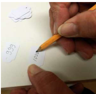
Registreren van objecten

De oudheidkamers streven naar een professionele aanpak zowel op het gebied van collectiebeheer, tentoonstellen, registratie als publieksbegeleiding.