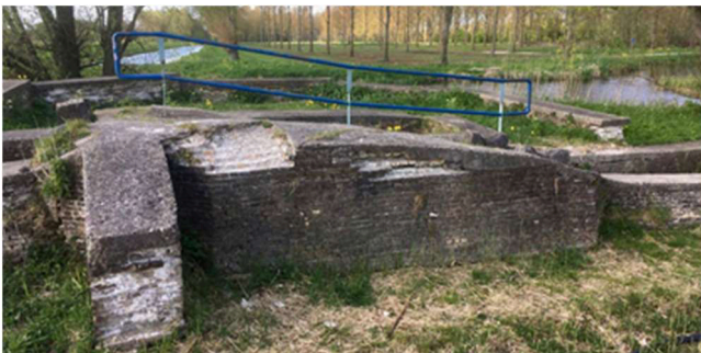
Essemolen fundament – Hitlandgebied Nieuwerkerk

Dit zijn initiatieven van vele organisaties die geld kosten maar die zichzelf ook op den duur terug betalen. De benodigde kennis voor informatievoorziening is aanwezig bij de historisch organisaties, Wij zijn overigens vertegenwoordigd in het bestaande recreatieplatform.